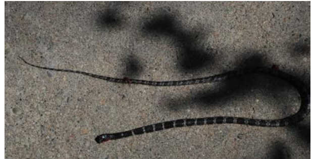
图 3 被车碾压的黑背白环蛇成体,拾获于天津市蓟州区 Fig. 3 Road-killed Lycodon ruhstrati , Jizhou district, Tianjin city