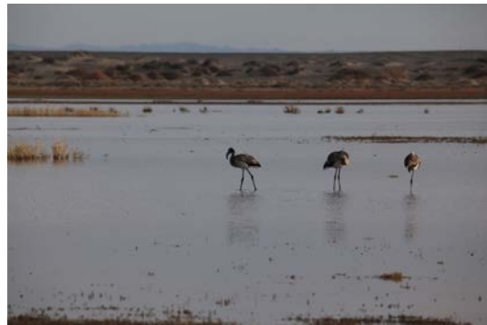
大红鹳 Phoenicopterus roseus