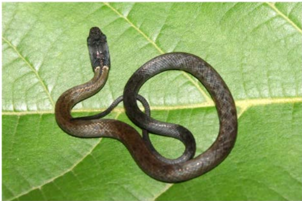
图 2 黑头剑蛇幼体,采集于天津市蓟州区 Fig. 2 Juvenile Sibynophis chinensis , Jizhou district, Tianjin city