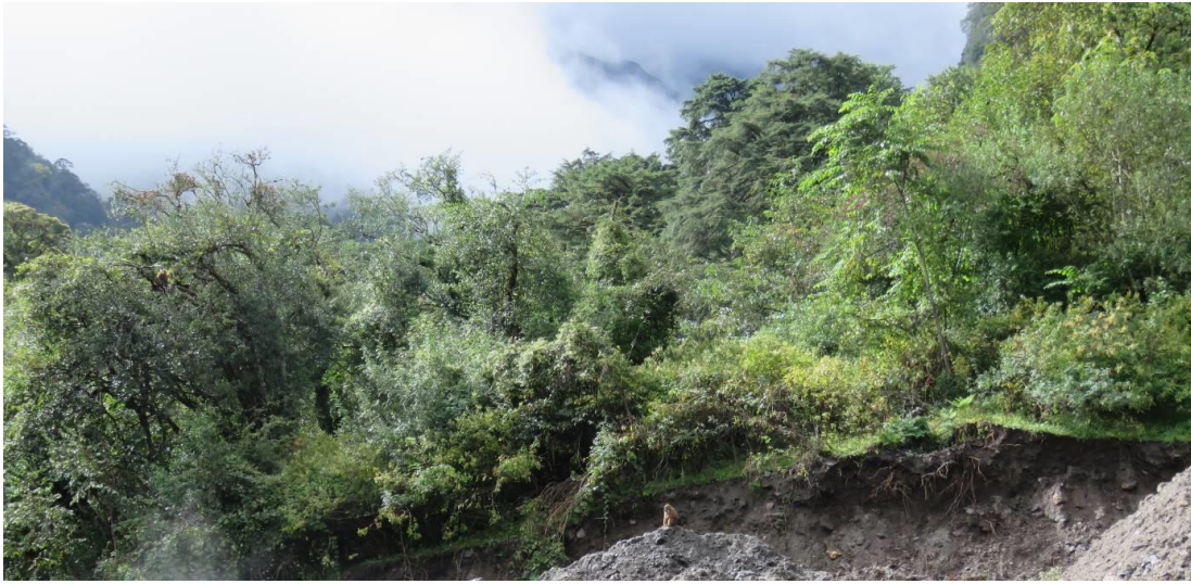
图 2 藏南猕猴的生境